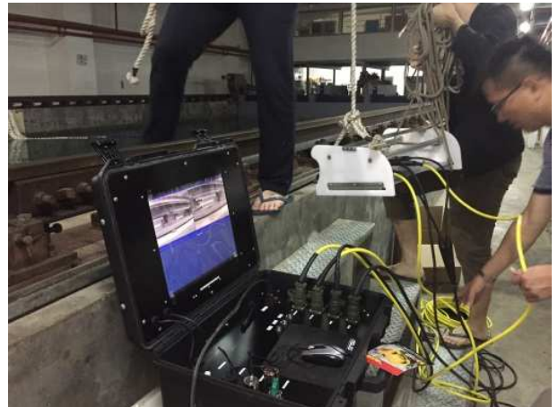
系統影像各項功能運作正常